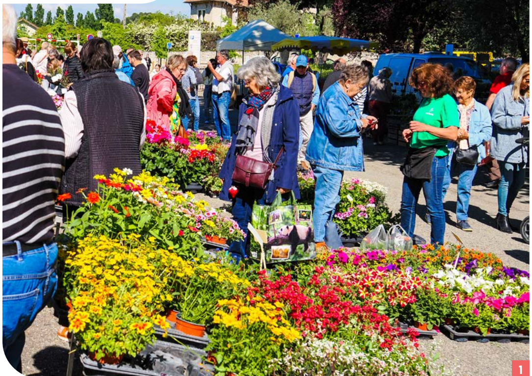
[1] Vendredi 8 mai, les Fleuralies reviennent, de 9h à 17h, place Burrus.

Entrée libre et gratuite toute la journée de 9h à 17h, place Burrus.