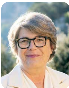
Sophie RIGAUT Conseillère départementale du canton de Vaison-la-Romaine